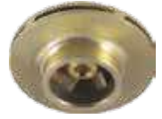
Bronz Fan (Opsiyonel)